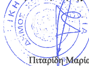
Πιταρίδη Μαρία Πολιτικός Μηχανικός

ΘΕΩΡΗΘΗΚΕ 18 / 04 / 2019 Η Προϊσταμένη της Δ/σης