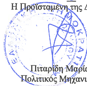
Πιταρίδη Μαρία Πολιτικός Μηχανικός

ΘΕΩΡΗΘΗΚΕ 18/04/2019 Η Προϊσταμένη της Δ/σης